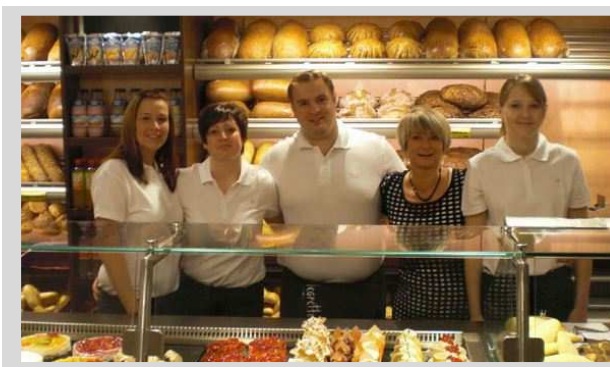
Mitarbeiter der Bäckerei Krätzer