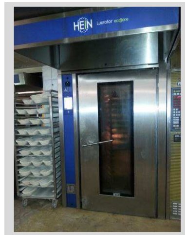
Neuer Backofen

Seit dem Austausch des alten Backofens gegen einen neuen wird die Restwärme weiter genutzt. Zudem gibt es nun eine Entkalkungsanlage, die für eine effizientere Beschwädung der Backwaren sorgt. Der neue Ofen produziert kaum Abwärme, so dass viel Strom gespart werden kann.