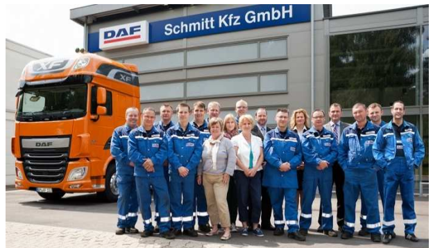
Team Firma Schmitt