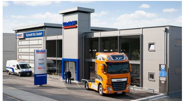
Ansicht Betrieb