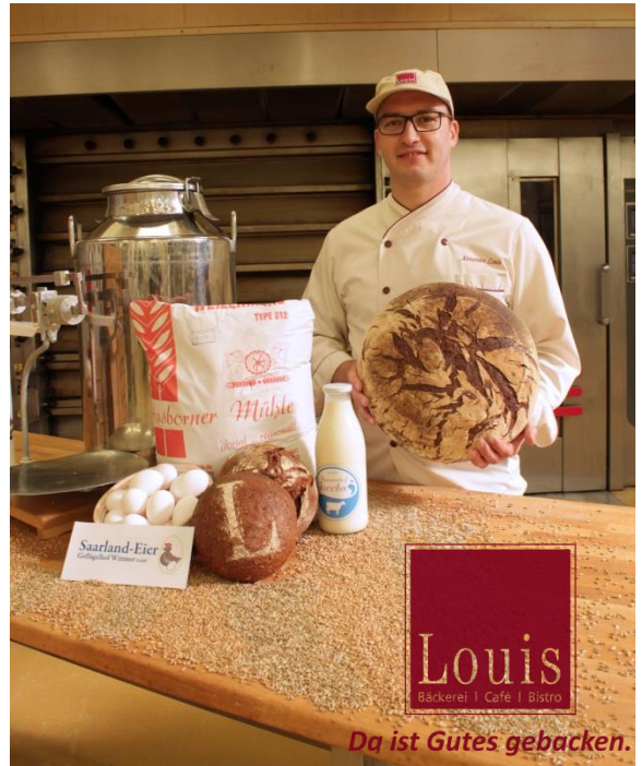
GS Alexander Louis schwört auf Zutaten aus regionalem Anbau