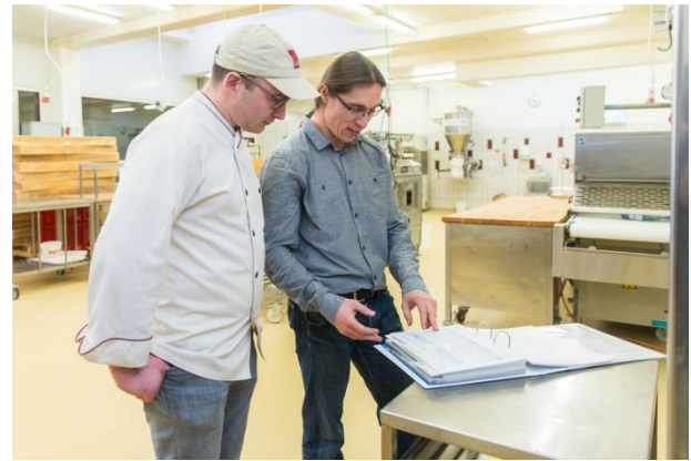
Energiebuch-Datenaufnahme mit einem Mitarbeiter des Saar-Lor-Lux Umweltzentrums

Seit 2017 führt die Bäckerei Louis das Energiebuch in digitaler Form („E-Tool“) für Ihre Hauptfiliale in Weiskirchen. Bereits drei vollständige Jahresdatensätze wurden erfasst und geben nun Aufschluss über die energetische Entwicklung des Standortes in den Bereichen Stromverbrauch, Wärmenutzung, Kraftstoff- und Wasserverbrauch. Zusätzlich werden die betrieblichen CO 2 -Emissionen dargestellt und Daten zu Maschinen, Anlagen und Fahrzeugen erfasst. Als Controlling-Instrument hilft das Energiebuch so, Schwachstellen aufzuzeigen und zukünftige Effizienzmaßnahmen zu priorisieren.