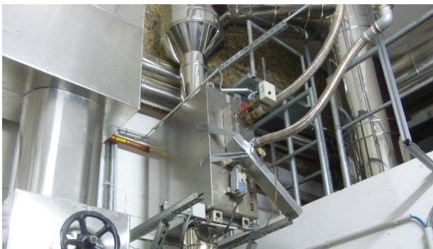
Abwärmenutzung © Saar-Lor-Lux Umweltzentrum