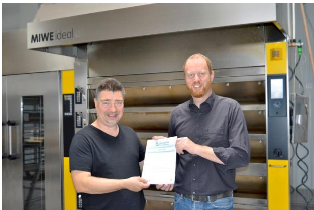
Übergabe des Sächsischen Gewerbeenergiepasses