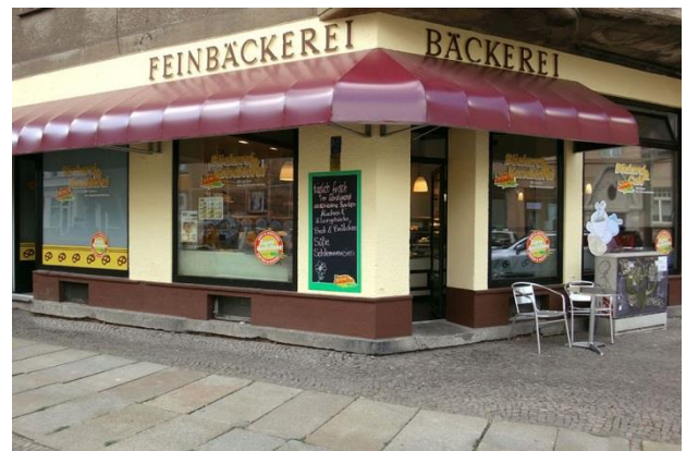
Außenansicht Filiale Ehrensteinstraße Bäckerei Schladitz