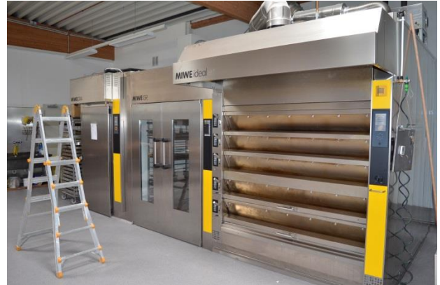
Neuer Etagen-Backofen

Bäcker Heiko Mangold übernahm 2007 die Traditionsbäckerei Schladitz. Im Jahr 2017 nutzte er einen zwingenden Standortwechsel, um die Backtechnik zu modernisieren. Die neue Backstube ist mit einem modernen Etagenbackofen mit separat regelbaren Herdgruppen, Gärraum und Gärvollautomaten ausgestattet. Die aus den Rauchgasen des Ofens gewonnene Abwärme wird in einem Pufferspeicher zwischengespeichert, um diese dann für die Heizungswärme- und Warmwassererzeugung wieder zur Verfügung zu stellen. Außerdem hat Heiko Mangold die vorhandenen Leuchtmittel gegen LED austauschen lassen.