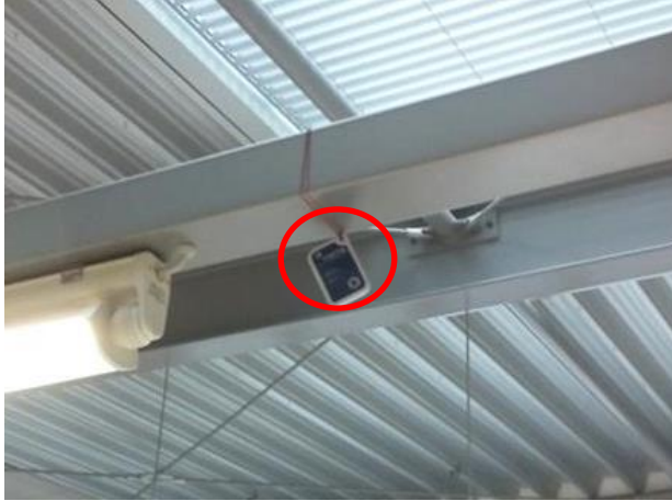
Einsatzbeispiel eines Datenloggers zur Raumtemperaturüberwachung