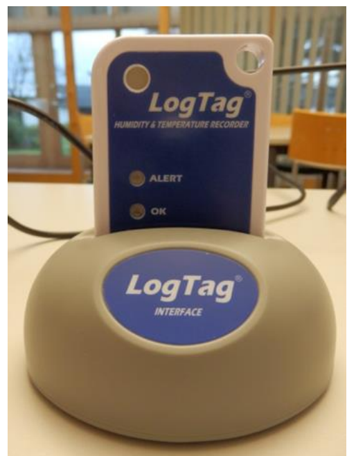
LogTag LTI-Interface