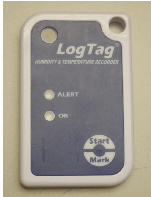
LogTag® HAXO 8-Datenlogger